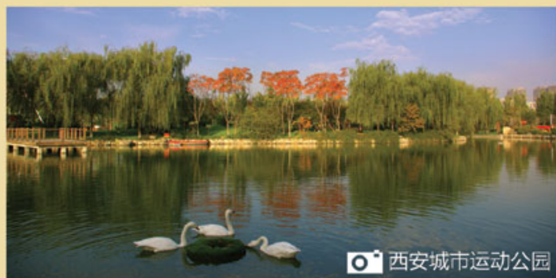
西安城市运动公园

和城运公园同步建设的，还有经发学校。如果说城运公园建设提升了北城的区域环境，那么经发学校的建设，则是对当时区域教育资源匮乏最有利的支持。经发学校的建设几乎和城运公园、白桦林居的建设同步，公司人员紧张，但毫不放松对经发学校的建设，按期保质交付了环境优美、设施齐全的经发学校。